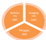
Σχήμα 2: Κύκλος Ποιότητας

Το υποσύστημα ΣΔΠ Ερευνητικού Έργου του Συστήματος Διασφάλισης Ποιότητας καθορίζεται από την υιοθετούμενη Πολιτική Ποιότητας (αντικείμενο του παρόντος τεύχους) και αναλύεται σε σύνολο διαδικασιών για τη Διαχείριση Ποιότητας (ΣΔΠ), τον Έλεγχο Ποιότητας (ΣΕΠ) και τη Βελτίωση Ποιότητας (ΣΒΠ).